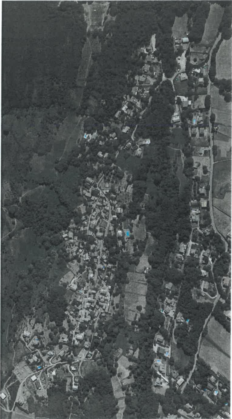
Secteur hameau de Crosciano